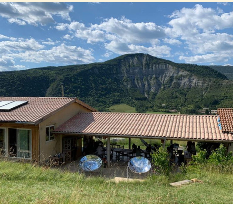
Photo du lieu de retraite